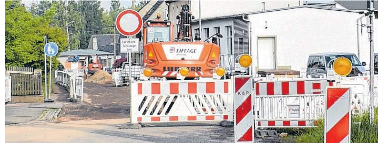
Krafffahrer müssen mit zahlreichen Sperrungen rechnen.

Mariestraße zwischen Schumannplatz und Lieferzufahrt der Zwickau-Arcaden einschließlich Rosengäßchen bis 23. Dezember Vollsperrung in Abschnitten. Grund: Straßenausbau und Neugestaltung.