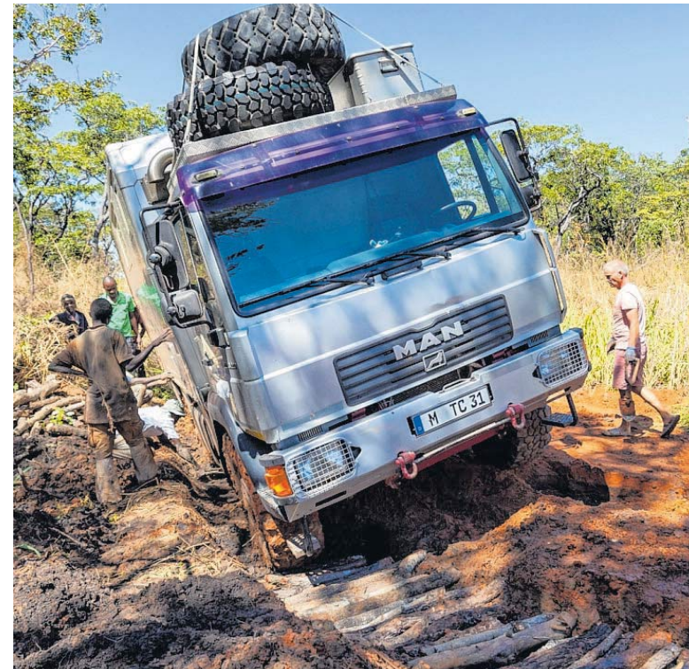
„Manni“ wird in Sambia aus dem Matsch befreit.